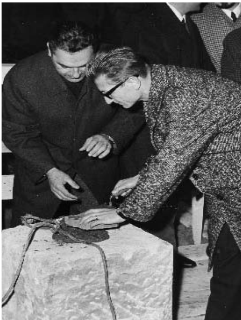
La posa della prima pietra della nuova sede dell'«Avvenire d'Italia» (1962)