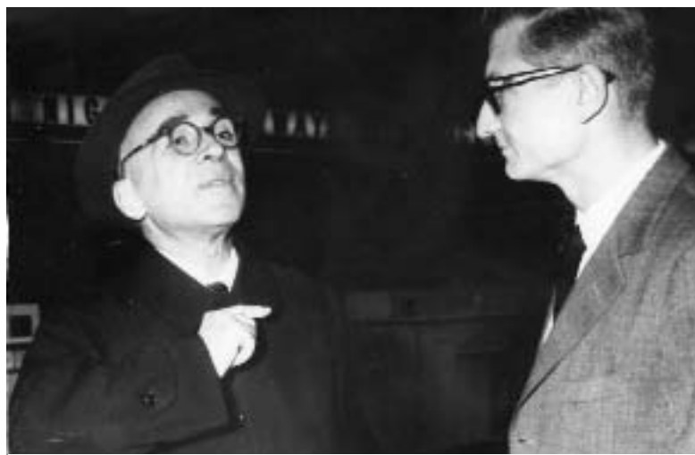
Con Giorgio La Pira